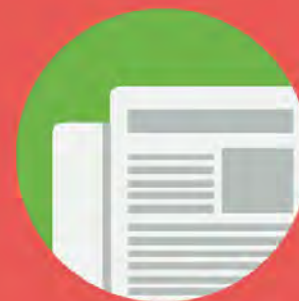
LES RÉALISATIONS JOURNALISTIQUES

Alain Devalpo, journaliste indépendant depuis 20 ans,