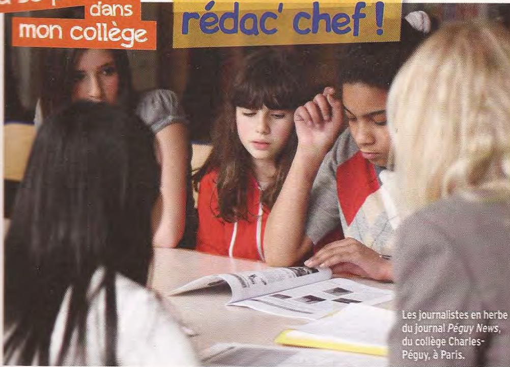
Les journalistes en herbe du journal Péguy News , du collège Charles- Péguy, à Paris.