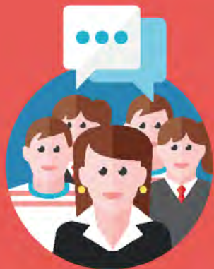
LA RÉDACTION L'enseignant(e) + la classe

Quand les élèves deviennent rédacteurs en chef, le journalisme participatif et citoyen devient un outil pédagogique innovant.