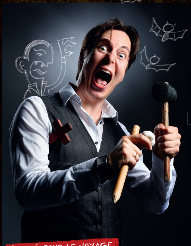
Illustration : Olivier Huette/Milan presse.